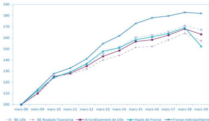
Evolution annuelle du nombre de demandeurs d'emploi de catégories ABC selon le sexe et l'âge (base 100 au 31 mars 2009)